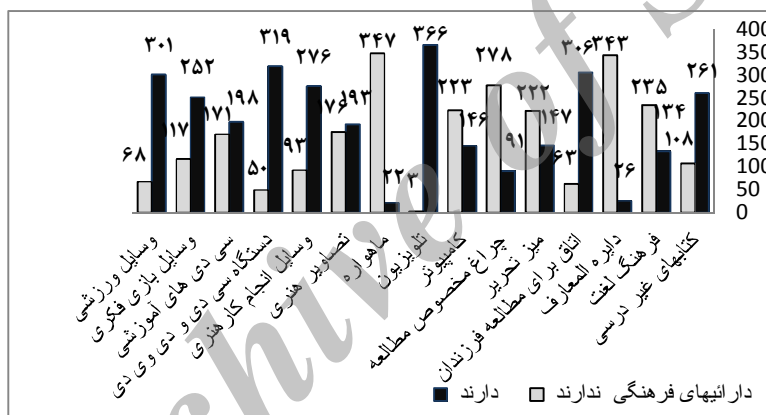
نمودار شماره (۱) - وضعیت دارایی‌های فرهنگی در نمونه‌ی تحقیق

این شاخص از سرمایه‌ی فرهنگی از معدود شاخص‌هایی است که در بسیاری از تحقیقات تجربی اختلاف نظر چندانی درباره‌ی آن وجود ندارد. بعد از گردآوری اطلاعات و انجام آزمون اولیه و تحلیل پاسخ‌های پاسخ‌گویان تعدادی از کالاهای فرهنگی مانند تلویزیون و دستگاه پخش موسیقی به دلیل عمومیت داشتن و ماهواره به دلیل عدم عمومیت در جامعه‌ی آماری مورد بحث از تحلیل حذف گردید. نمودار شماره (۱) خلاصه‌ای از وضعیت این شاخص سرمایه فرهنگی در نمونه‌ی تحقیق می‌باشد.