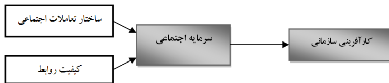
شکل شماره‌ی سه - مدل مفهومی تحقیق