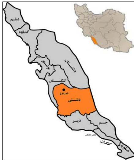
شکل شماره‌ی دو- موقعیت مکانی شهر خورموج و محلات ۱۰ گانه‌ی آن بر روی نقشه