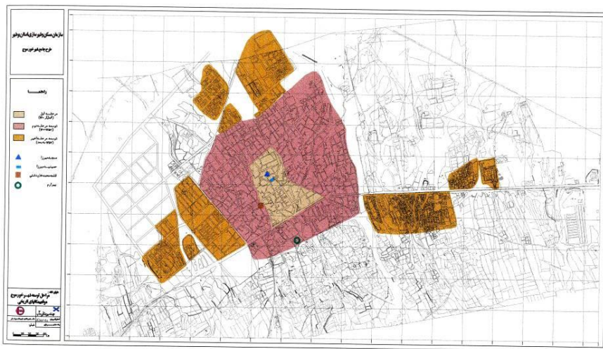
شکل شماره‌ی یک- نقشه‌ی مراحل توسعه‌ی شهر خورموج (منبع: مهندسین مشاور مآب، ۱۳۸۶)

توسعه پیدا کرده است. در بخش شمالی توسعه، در این مرحله، شبکه‌ها و خیابان‌ها منظم و نسبتاً عریض می‌باشند. برخلاف بخش شمالی، در بخش جنوبی این قسمت از بافت شهر، شبکه‌ی راه‌ها و میدان‌چه‌های ارتباطی نامنظم بوده و شبیه بافت مرکزی و قدیمی شهر است (مهندسین مشاور طرح آبادی، ۱۳۷۰). شایان ذکر است شهرک‌های شهید شهریار، چمران، پاسداران و مدرس، جزء نواحی جدید در اطراف شهر محسوب می‌شوند. در جنوب، در شرق و غرب جاده، محله‌های خودرو و مهاجرنشین به نام لنگک و خمینی‌آباد نیز جزیی از بافت‌های توسعه‌ی اخیر به حساب می‌آیند (مهندسین مشاور مآب، ۱۳۸۵: ۳). در ادامه، نقشه‌ی مراحل توسعه‌ی شهر خورموج قابل مشاهده است (شکل ۱).