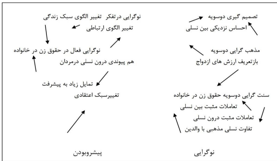
نقشه‌ی شماره‌ی دو- تعیین موقعیت گفتمان نوگرایی پیشرو

با بررسی پراکندگی مقوله‌ها، وزن مقوله‌های سنت‌پیشگی، نسبت به مقوله‌های نوگرایی محسوس است. اما نمی‌توان از حضور مقوله‌های مرتبط با نوگرایی به آسانی گذر کرد. نکته‌ای که تعامل میان نسل‌ها را فعال نگاه می‌دارد.