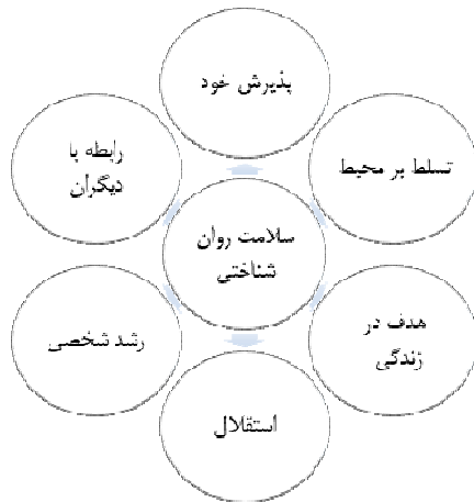
شکل ۱- مدل سلامت روان‌شناختی ریف (ریف، ۱۹۸۹a)

علم سلامت روان، شاخه‌ای از علم روان‌شناسی است که با پیشگیری از اختلال‌های روانی و حفظ شیوه‌های بهینه زندگی و بهداشت عاطفی سروکار دارد (شبیوری، ۱۳۹۲). سازمان بهداشت جهانی (۲۰۰۳) سلامت روان را در مفاهیمی چون سلامت ذهنی، خودکارآمدی درک‌شده، خودمختاری، شایستگی و شناخت توانایی تحقق پتانسیل‌های ذهنی و احساسی تعریف می‌کند. برخی از نظریه‌پردازان مانند آلپورت ۱ ، فروم ۲ ، راجرز ۳ ، مازلو ۴ ، اریکسون ۵ ، یونگ ۶ و فرانکل ۷ به جنبه سالم طبیعت آدمی می‌پردازند. این روان‌شناسان در تلاش جهت غنابخشیدن به شخصیت انسان هستند و بازخورد منحصر به فردی در خصوص تحول روانی و کمال انسانی عرضه می‌کنند. در مقابل، گروه دیگر در تعریف سلامت روان‌شناختی به رفتار ناپه‌نجان یا بیماری روانی متصل متوسط می‌شود و نتیجه می‌گیرند که در واقع، سلامت روان‌شناختی مساوی با فقدان بیماری روانی می‌باشد. بدیهی است، سلامت افراد تنها به سلامت جسمانی محدود نمی‌شود؛ بلکه جنبه‌های روانی و اجتماعی زندگی آنان را نیز در برمی‌گیرد (محمدی، ۱۳۸۵). در واقع، سلامت روان‌شناختی به وضعیتی گفته می‌شود که افراد توانایی خود را درک کرده، کارآمد و بهره‌ورتر بوده و قادرند با تنش‌های طبیعی زندگی مقابله کنند و به جوامع خود کمک نمایند (فریدلی، ۲۰۰۹). از نظر ریف (۱۹۸۹a) سلامت روان‌شناختی، دارای جنبه‌های مختلفی می‌باشد که در شکل ۱، نشان داده شده است.