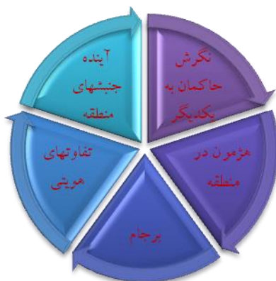
شکل ۴- پیش‌رانه‌های نهایی میک‌مک

۵- آینده جنگ در عراق، سوریه و... و تأثیر آنها بر روابط ایران و شورای همکاری.