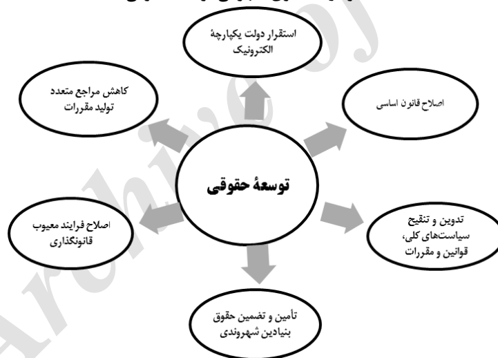
نمودار ۲. الگوی مفهومی توسعه حقوقی