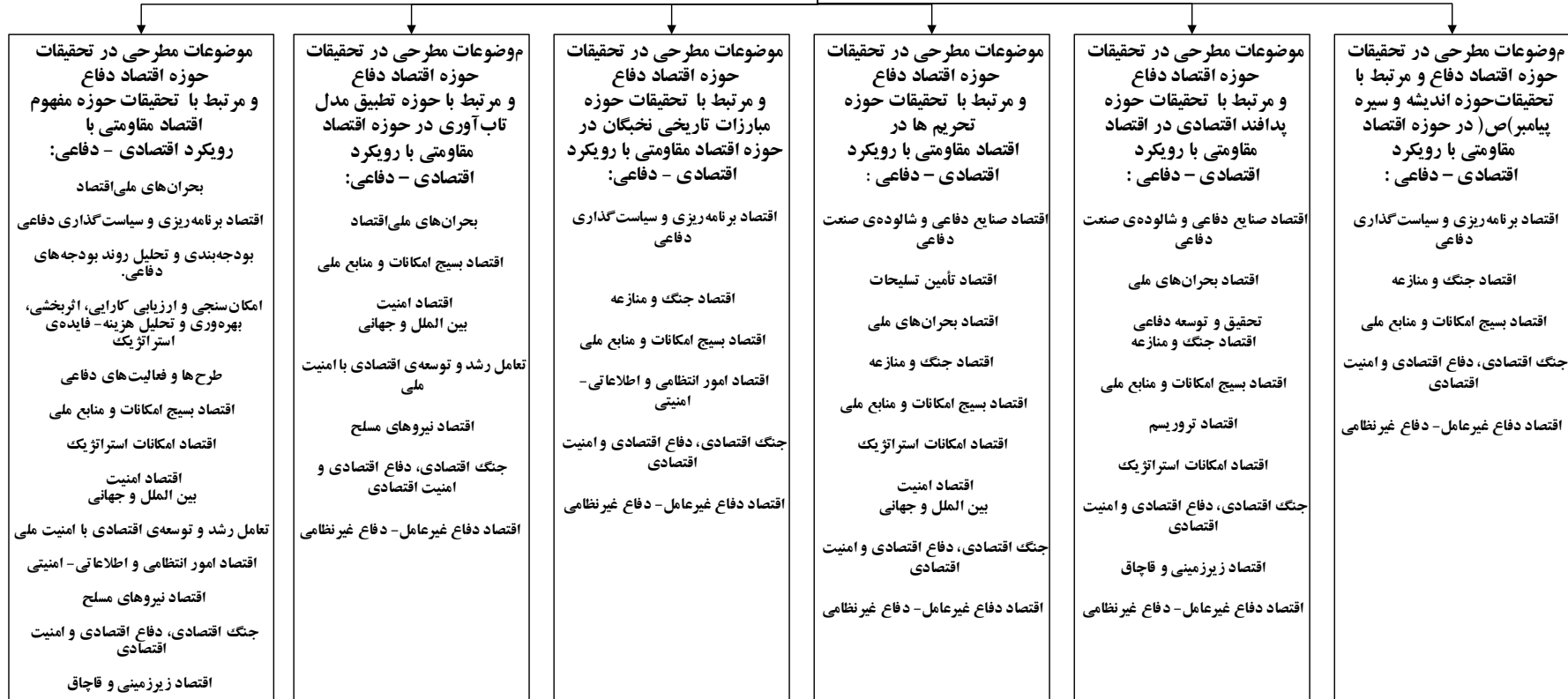
شکل ۳. دسته‌بندی تحقیقات اقتصاد مقاومتی با رویکرد اقتصادی - دفاعی به صورت ۶ دسته تحقیقات زیر مجموعه اقتصاد دفاع