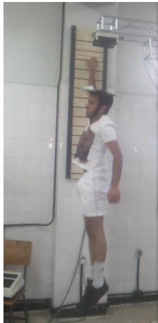
شکل ۳: نحوه‌ی انجام پرش عمودی