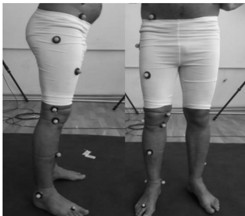
شکل ۱: محل قرارگیری مارکرها بر روی بدن

کینماتیکی مفصل زانو به وسیله دستگاه موشن آنالایزر ۱ مدل Raptor-H Digital Real Time System ساخت کشور آمریکا و با شش دوربین اندازه‌گیری شد. نحوه چیدمان دوربین‌ها با توجه به نوع آزمون به گونه‌ای بود که