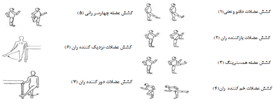
شکل ۵: ترتیب و نوع کشش برای عضلات اندام تحتانی