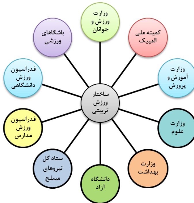
شکل ۲- سازمان‌ها و دستگاه‌های دخیل در مدیریت ورزش تربیتی ایران