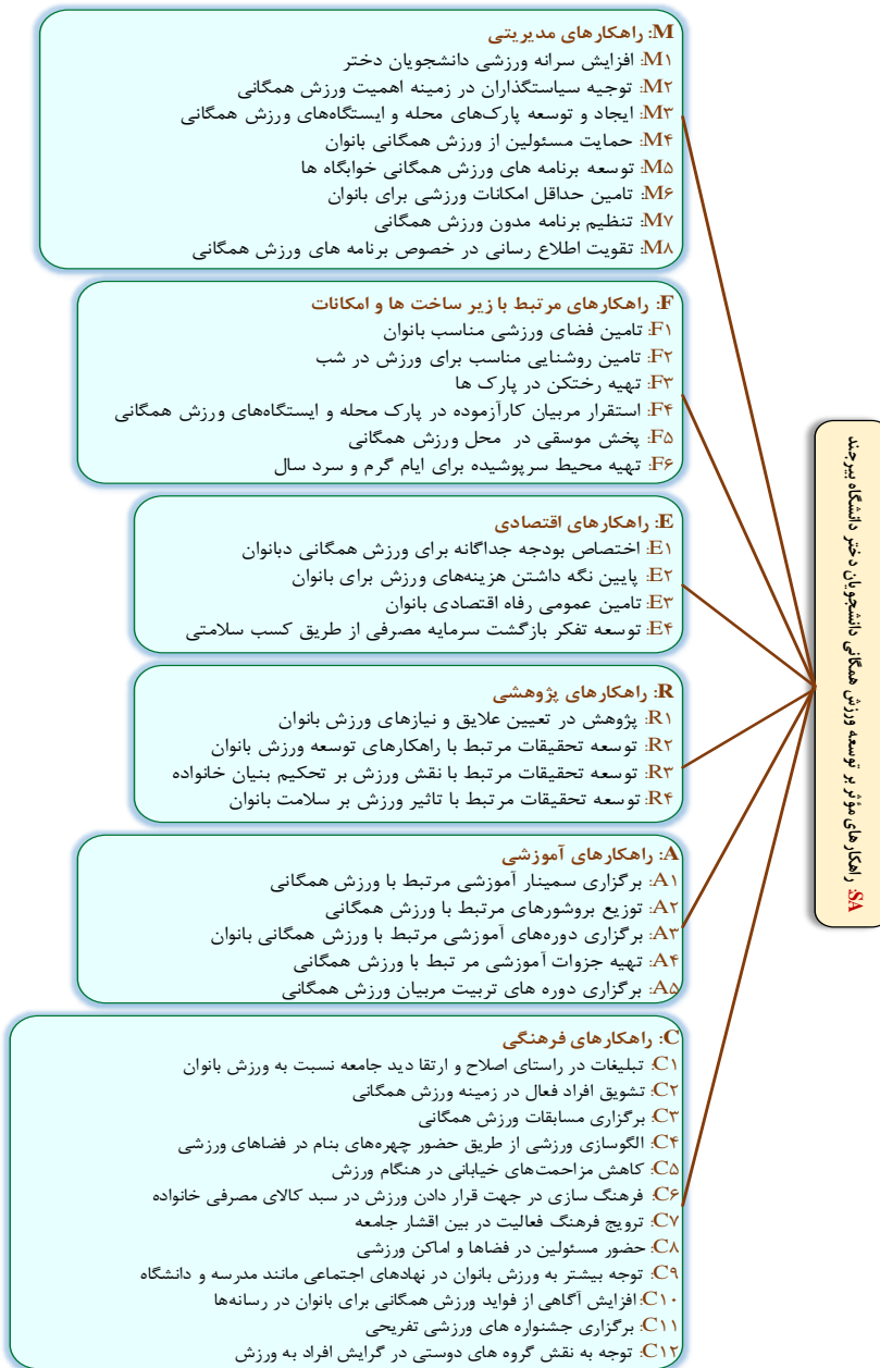
شکل ۱- راهکارهای توسعه ورزش همگانی دانشجویان دختر دانشگاه بیرجند