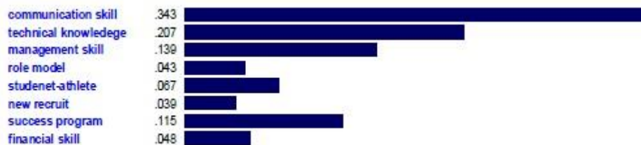
شکل ۲- نمودار مستخرج از مقایسه‌های زوجی مؤلفه‌ها از طریق نرم‌افزار اکسپرت چویس

با توجه به استفاده از روش ای.اچ.پی. برای اولویت‌بندی مؤلفه‌ها در شکل زیر نمودار مستخرج از نرم‌افزار اکسپرت چویس مشاهده می‌شود.