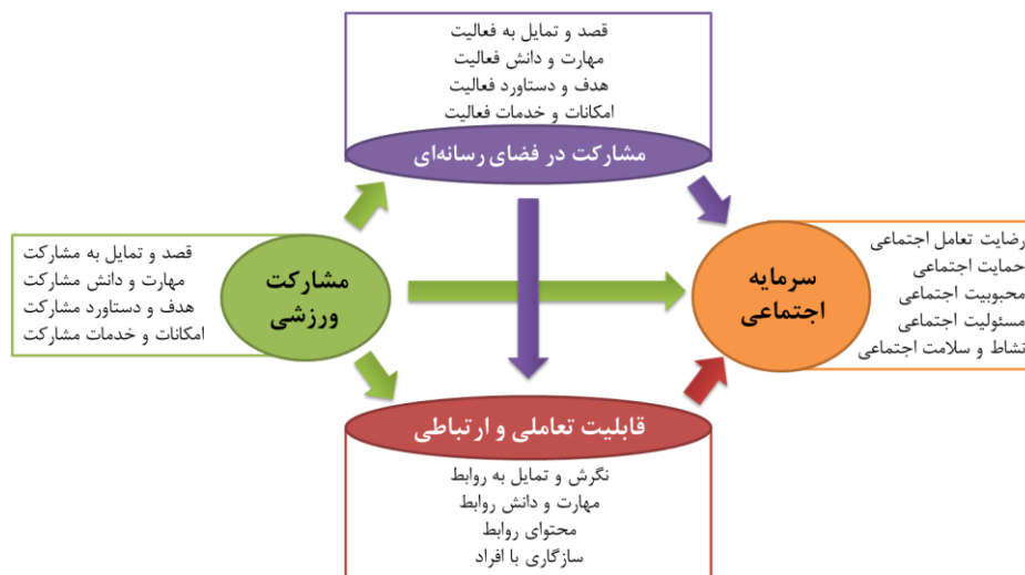
شکل ۱- مدل مفهومی پژوهش

مجازی در رابطه مشارکت ورزشی و سرمایه اجتماعی تاچه اندازه نقش دارد؟ متغیر قابلیت ارتباطی چگونه اثر رسانه و مشارکت ورزشی بر سرمایه اجتماعی را تعدیل و هدایت می کند؟ برای پاسخ به برخی از این سؤالها، به تعریف چهارچوبی مفهومی از رابطه مشارکت ورزشی و سرمایه اجتماعی و آزمون تجربی آن نیاز است. یکی از مناسبترین راهها برای پاسخ به سؤالهای مطرح شده، استفاده از مطالعات پیمایشی و آزمون سؤالهای فرضیه بندی شده است. اهمیت مدل سازی بدین دلیل است که مبانی اصلی دانش در هر حوزه ای بر پایه مدل های مناسب شناسایی شده توسط دانشمندان است؛ نه یافته های جزئی و پراکنده؛ زیرا، داده ها در قالب مدل می توانند کشف، تبیین و تعبیر شوند؛ البته مدل سازی از فراگردهای اجتماعی، جهان اجتماعی را لزوماً به طور کامل معرفی نمی کند؛ اما ابزاری به دست می دهد که درک مکانیسم های اساسی آن را آسان تر می کند (صفاری، ۱۳۹۱). در همین راستا، فقدان مدل های با قابلیت تحلیل بالا و دارای مصادیق بیرونی در توسعه رابطه بین ورزش، رسانه و جامعه، پژوهشگر را بر آن داشت تا به طراحی و تبیین مدلی در این زمینه بپردازد. در مدل مفهومی شکل شماره یک، روابط مفروض میان متغیرهای پژوهش ارائه شده اند. همان گونه که این مدل نشان می دهد، مشارکت ورزشی به عنوان متغیر مستقل، رسانه و قابلیت تعاملی به عنوان متغیر میانجی و سرمایه اجتماعی به عنوان متغیر وابسته در نظر گرفته شده اند.