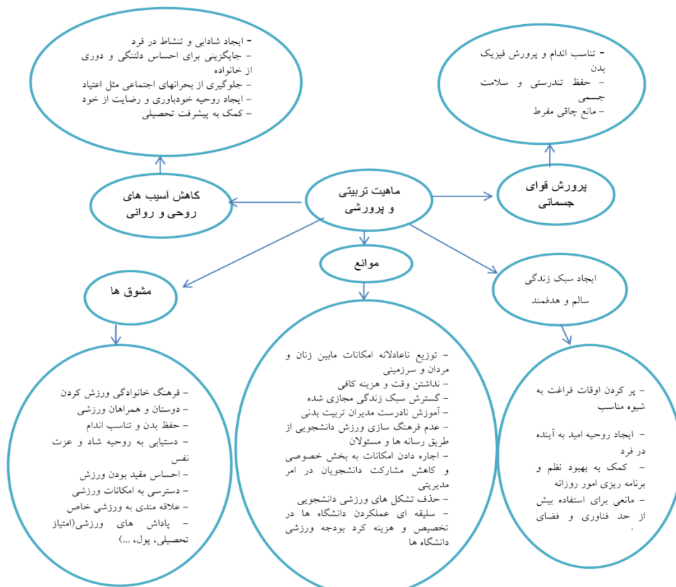
شکل شماره (۱)- شبکه مضامین مرتبط با چیستی ورزش دانشجویی

نخستین مضمون فراگیر که مرکز ثقل تمامی مصاحبه‌ها و مورد تأکید تمامی نمونه‌ها بوده است ماهیت تعلیمی و تربیتی ورزش دانشجویی در ایران است که حول سه مضمون پرورش قوای جسمانی، ایجاد سبک زندگی سالم و هدفمند و کاهش آسیب‌های روحی و روانی بیان شده است. مضمون فراگیر دیگری که در اکثر مصاحبه‌ها بر آن تأکید می‌شد توجه به موانع و ذکر مشوق‌هایی است که می‌تواند منجر به توسعه و گسترش و فرهنگ‌سازی ورزش دانشجویی در سطح کشور شود. بنابراین نتایج به‌دست آمده از مضامین فوق را می‌توان به صورت شبکه مضامین مرتبط با چیستی ورزش دانشجویی به صورت ذیل ارائه کرد: