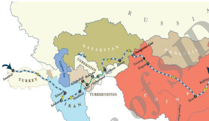
نقشه 3- مسیر خط آهن چین به اروپا و جایگاه آسیای مرکزی در آن

نقشه زیر مسیر خط آهن چین به اروپا را که آسیای مرکزی نقش حلقه وصل را بین دو طرف ایفا خواهد کرد، نشان می‌دهد.