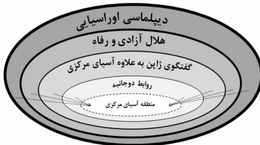
الگوی ۲: طرح‌های ژاپن در آسیای مرکزی

و اقتصادی در آسیای مرکزی به همکاری با قدرت هژمون در سطح جهانی و منطقه‌ای می‌پردازد. لذا ژاپن با حمایت شدن از سوی ایالات متحده آمریکا نوعی آسودگی خاطر بابت مسائل امنیتی در آسیای مرکزی دارد. به همین سبب توکیو بر خلاف سایر قدرت‌های هم‌پایه (روسیه، چین و اتحادیه اروپا) بر ابعاد اقتصادی همکاری‌ها در آسیای مرکزی تأکید بیشتری دارد. به طور کلی استراتژی‌های ژاپن در قبال آسیای مرکزی را می‌توان در دو دسته جای داد. نخست، راهبردهای که مستقیماً به آسیای مرکزی مربوط است مانند روابط دو جانبه و گفتگوهای آسیای مرکزی به علاوه ژاپن و دوم، راهبردهای که مربوط به یک منطقه بزرگ‌تر است مانند دیپلماسی اوراسیایی و هلال آزادی و رفاه، که آسیای مرکزی در چارچوب آنها مفهوم‌سازی شده است. نکته قابل توجه این است که تفاوت ماهوی در میان این طرح‌ها مشاهده نمی‌شود و در همه آنها مسایل اقتصادی برای ژاپن در اولویت بوده است. توضیحات فوق در نمودار زیر تصویرسازی شده است.