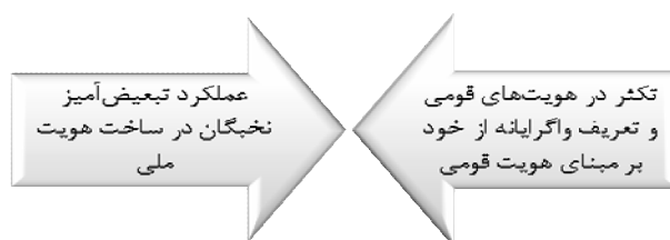
شکل شماره ۲: موانع ذهنی و عینی ساخت هویت ملی