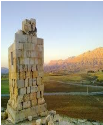
میل نورآباد ممسنی در استان فارس