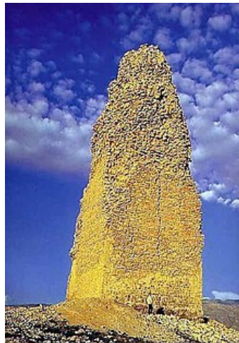
مناره فیروزآباد در استان فارس

ساخت مناره با هدف راهنمایی مسافران، پس از اسلام تا سده‌های اخیر در ایران رواج داشته است. به فرمان نادرشاه افشار، برای راهنمای کاروانیان و اردوهای جنگی، در صحرای بی‌آب و علف و کویرها، با سنگ، آجر و گچ مناره‌هایی ساخته شد که هنوز در ریگزارهای میان کرمان و بلوچستان باقی است و در برخی منابع و کتب لغت، با منار نادری از آن یاد شده است. (چارلز، ۱۳۶۵: ۱۱۳) ۱