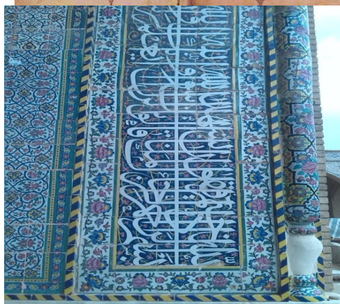
تصویر شماره ۴: کاربرد خط ثلث با نقوش اسلیمی و ختایی در کاشی‌کاری مسجد وکیل شیراز، دوره زندیه