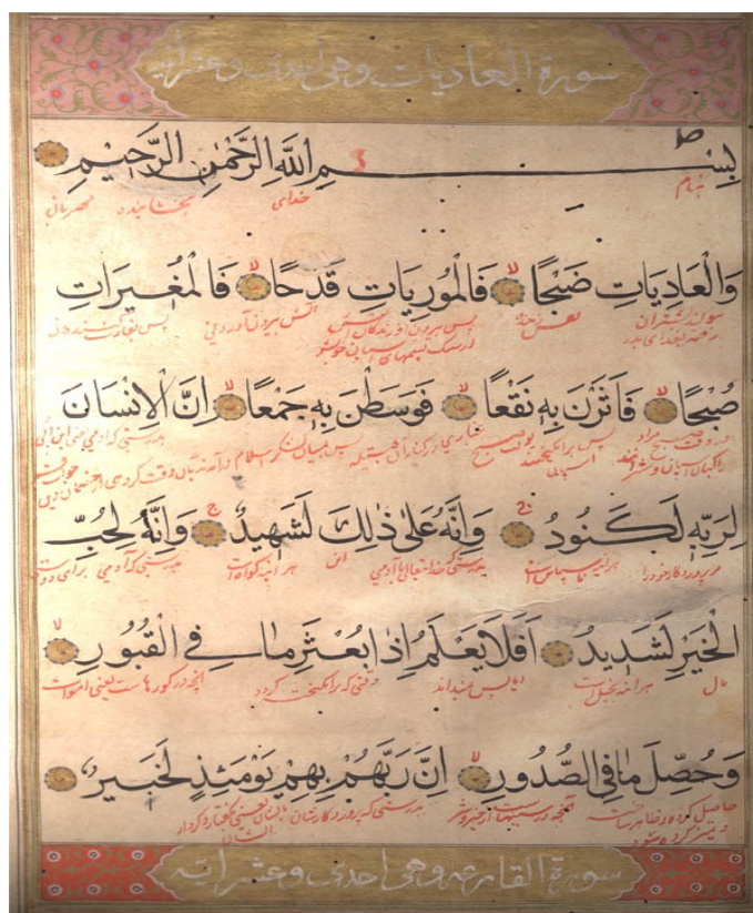
تصویر شماره ۲: برگی از قرآن به خط نسخ با ترجمه فارسی به خط نستعلیق، اوایل سده ۱۸ میلادی (مأخذ تصویر: درگاه اینترنتی wikimedia.org )

پروردگار از طریق بیان نمادگرایی حروف، تکامل یافت و درک حقایق معنوی و روحانی مسلمان را نیز در برداشت. به راستی، این جلوه‌گری و نقش بستن نمادین و روحانی خوشنویسی اسلامی، از نظر این دو اندیشمند سنت‌گرا، برای نشان دادن حقیقت قدسی ذات احدیت در ذهن مسلمانان در جهان اسلام، آیا معنایی جز تجلی قداست خوشنویسی در صورت و محتوای هنری خود در بین هنرهای اسلامی دارد؟ از این رو، زبان و بیان هنرمندان خوشنویس در جهان اسلام، متناسب با الهیات دینی و در جهت تجسم بخشیدن به کلام مقدس و حیانی بوده است.