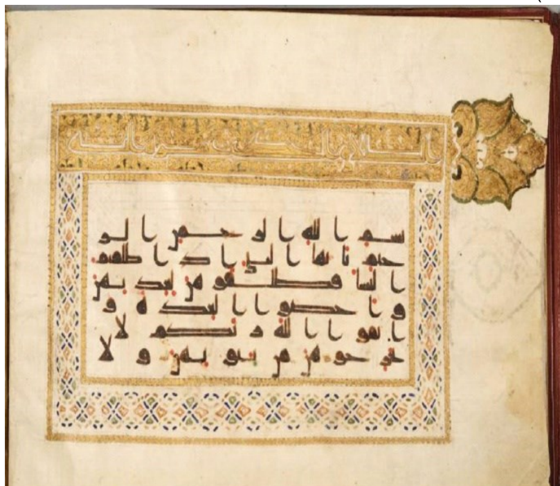
تصویر شماره ۶: قسمتی از قرآن کریم به خط کوفی بر پوست آهو، دارای رقم الحاقی علی بن ابی طالب (ع)، گنجینه اسلامی موزه ملی ایران، شماره موزه ۴۲۷۹ (ساریخانی و همکاران، ۱۳۹۳: ۹)

و هم او فرموده: «چکیده تمامی قرآن، در سوره اول آن مندرج است. سوره اول نیز خود در «بسم الله»، بسم الله در «ب» و «ب» در نقطه زیر این حرف خلاصه شده و من، آن نقطه‌ام» (همان). از این رو، خط کوفی ساده، نمونه‌ای از خطوطی است که از هر نوع اعراب و نقطه‌گذاری خالی است و این نمونه خط، در قرن اول هجری در بین مسلمانان ترویج شده که برای مثال، به قرآن‌های کتابت‌شده به وسیله امام علی (ع) می‌توان اشاره نمود (تصویر شماره ۶).