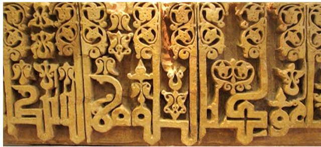
تصویر شماره ۱: کتیبه‌ای با خط کوفی مورق یا مشجر، مدرسه خرگرد خراسان، دوره سلجوقی، موزه ایران باستان، دوره اسلامی (مأخذ: مکی‌نژاد، ۱۳۹۷: ۲۱)

تأثیری به جای گذاشته‌اند. فی‌المثل ایرانیان گونه‌ای شیوه پُرانحنای زیبا ابداع کردند [و] بسیار روان و چابک و بدان، زبان خود را با الفبای عربی می‌نوشتند. شیوه مغربی که از اسپانیا تا سواحل شرقی آفریقا رایج بود، به همان درآمیختگی نسبی کهن کوفی و نسخ، وفادار مانده است. سبک آن، خواه عمودی، خواه افقی، قرص و جلی و پُرانکسار و چشمگیر است و دارای حلقه‌ها و گره‌های باز است» (همان: ۶۲).