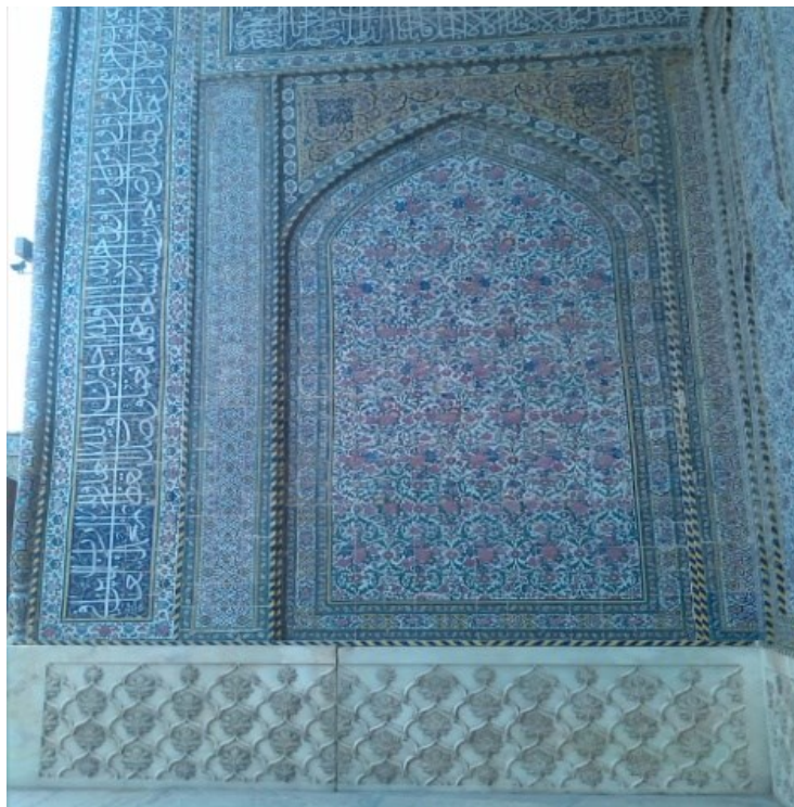
تصویر شماره ۵: کاربرد خط ثلث به عنوان کتیبه کاشی‌کاری در معماری اسلامی،

آیات مقدس قرآنی و اشعار مذهبی بر دیواره‌ها و محراب مساجد در قالب کتیبه‌های مقدس، نتیجه و پیامد تعیین‌کننده‌ای در ابلاغ دین مبین اسلام دارد. آراستن بناهای اسلامی با کتیبه‌های خطی با آیات قرآنی و تزیینات اسلیمی، خود صورتی است از بیان روحانی جلال و جمال مقدس ذات کبریایی پروردگار که با هنر خوشنویسی اسلامی بر گستره دیوارها و محراب مساجد، متجلی گردیده است.