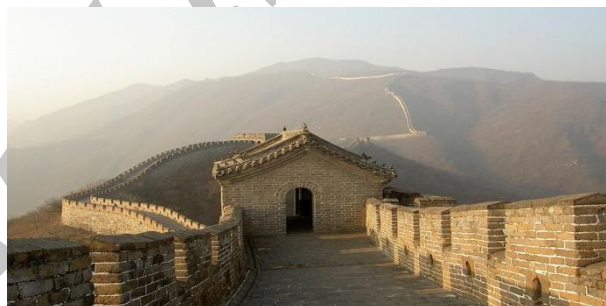
تصویر شماره ۱: دیوار چین