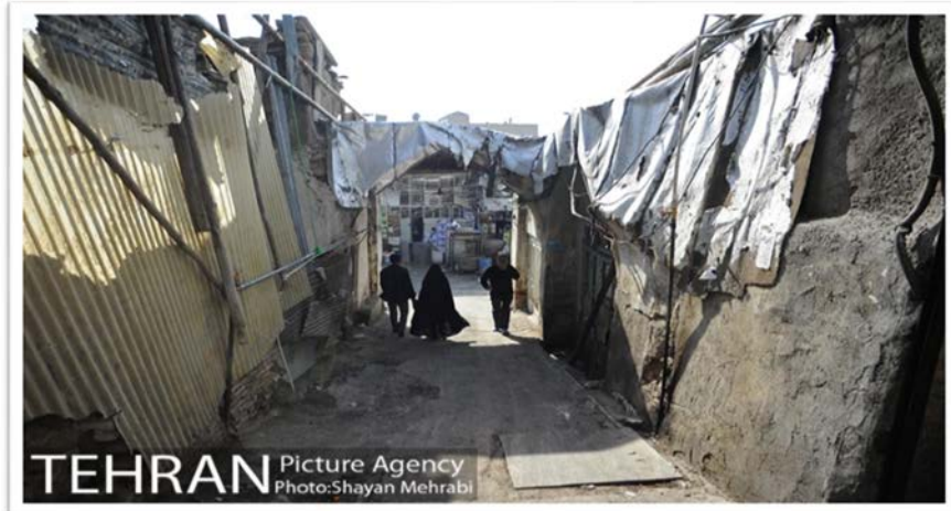
منطقه 12 شهر تهران (ایران)