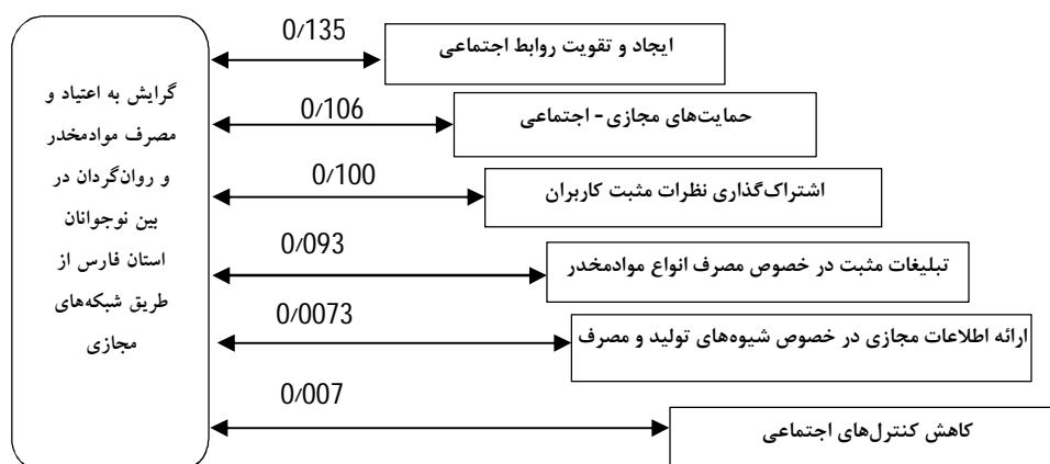
شکل شماره (2). مدل نهایی پژوهش.

در خصوص بررسی نقش مؤلفه‌های جمعیت‌شناختی در میزان گرایش به اعتیاد و یا همان اعتیادپذیری نوجوانان نیز برابر آزمون تی دو نمونه انجام شده، چون میزان سطح معنی‌داری به دست آمده برای تمام ابعاد جمعیت‌شناختی بزرگ‌تر از میزان سطح خطا (0/5) می‌باشد، بنابراین نوع جنسیت، سن، مقطع تحصیلی، میزان درآمد، شغل پدر و مادر و تحصیلات پدر و مادر بر سطح گرایش به اعتیاد و یا اعتیادپذیری نوجوانان تأثیری نگذاشته است؛ بنابراین با توجه به نتایج به دست آمده مدل نهایی پژوهش به شرح زیر قابل ارائه می‌باشد.