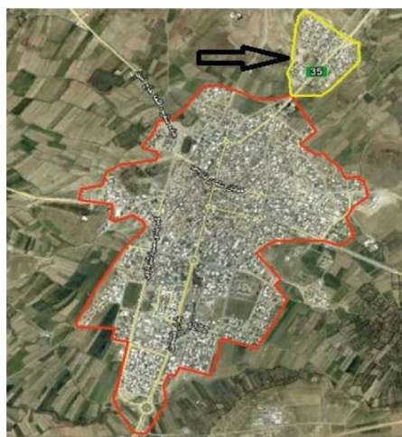
نگاره ۱: موقعیت شهرک حاشیه‌نشین شهدا نسبت به شهر سنقر بر روی google earth

ماتریس ارزیابی عوامل درونی، حاصل بررسی عوامل درونی سیستم می‌باشد. این ماتریس، نقاط قوت و ضعف اصلی درونی سیستم را تدوین و ارزیابی می‌نماید. (زمانیان و همکاران، ۱۳۸۹، ۱۸۹) فرایند ارزیابی محیط درونی، موازی با فرایند بررسی عوامل بیرونی است. (Roberts and Sykes, 2000, 46) ماتریس ارزیابی عوامل بیرونی، حاصل بررسی عوامل بیرونی سیستم می‌باشد. این ماتریس، نقاط فرصت و تهدید اصلی بیرونی سیستم را تدوین و ارزیابی می‌نماید. عوامل درونی و بیرونی تأثیرگذار بر توانمندسازی شهرک شهدا طی ۴ گام مورد ارزیابی قرار می‌گیرد.