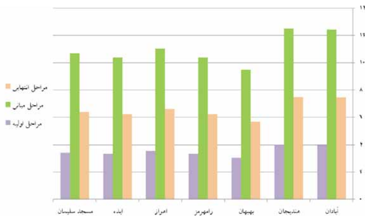
نگاره ۴: میزان تبخیر و تعرق گیاه نیشکر در مراحل مختلف رشد (مراحل اولیه، میانی و پایانی) در میانگین بلند مدت ماهوت

در روز (۹۸/۶ میلیمتر در ماه) اتفاق می افتد. در این مرحله از رشد، بیشترین میزان تبخیر و تعرق گیاه به واسطه تبخیر از سطح خاک صورت می گیرد. به طوری که تقریباً ۱۰۰ درصد تبخیر و تعرق به صورت تبخیر از سطح خاک انجام می گیرد (احسانی و همکاران، ۱۳۹۱). به همین دلیل کمترین میزان تبخیر و تعرق در این مرحله از رشد اتفاق می افتد. در مراحل میانی رشد، ایستگاه هندیجان با ۱۳/۲۱ میلیمتر در روز (۴۰۹ میلی متر در ماه) و بعد از آن ایستگاه آبادان با ۱۲/۸۰ میلیمتر در روز (۳۹۷ میلیمتر در ماه) بیشترین میزان تبخیر و تعرق این گونه زراعی را دارا می باشند. در مقابل ایستگاه بهبهان با ۹/۹۱ میلیمتر در روز (۳۰۷ میلیمتر در ماه) و سپس ایستگاه ایذه با ۹/۹۳ میلیمتر در روز (۳۰۸ میلیمتر