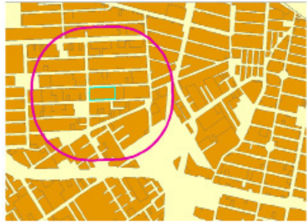
نگاره ۲: نمایشی از تحلیل‌های مکانی انجام شده

شده برای هر عارضه، یک سطر از ماتریس را پر می‌کند.