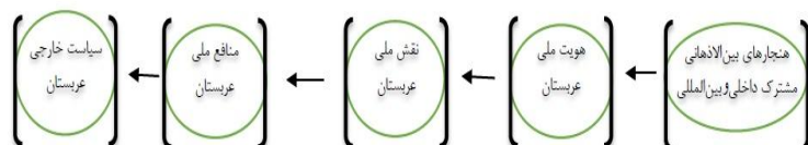
نمودار ۱- مدل سیاست خارجی عربستان برگرفته از مدل کلی سیاست خارجی دکتر دهقانی فیروزآبادی

این نظریه یکی از نظریه‌های مهم روابط بین‌الملل است که در آن تلاش می‌شود مسائل عمده سیاست بین‌الملل از جمله سیاست خارجی کشورها بررسی شود. در این مقاله به بررسی سیاست خارجی عربستان در قالب دیپلماسی عمومی پرداخته شده است. این کشور در صدد است تا با برقراری روابط دیپلماتیک با دیگر کشورها به منافع ملی خود دست یابد که رسیدن به منافع ملی باعث تحقق سیاست خارجی آن می‌شود و برای این کار از هویت و فرهنگ خود استفاده می‌کند.