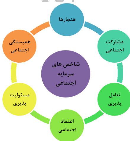
شکل ۱- شاخص‌های سرمایه اجتماعی

انسجام و همبستگی اجتماعی: انسجام اجتماعی به معنای آن است که گروه وحدت خود را حفظ کرده و با عناصر وحدت‌بخش خود تطابق و هم‌نوایی داشته باشد. همبستگی و انسجام، احساس مسئولیت بین چند نفر یا چند گروه است که از آگاهی و اراده برخوردار باشند و حائز یک معنای اخلاقی است که متضمن وجود اندیشه یک وظیفه یا الزام متقابل است و نیز یک معنای مثبت از آن بر می‌آید که وابستگی متقابل کارکردها، اجزا و یا موجودات در یک کل ساخت یافته را می‌رساند. در دیدگاه جامعه‌شناسی، همبستگی پدیده‌ای است که بر اساس آن در سطح یک گروه یا یک جامعه، اعضا به یکدیگر وابسته و به طور متقابل نیازمند یکدیگر هستند. این امر مستلزم طرد آگاهی و نفی اخلاقی مبتنی بر تقابل و مسئولیت نیست بلکه دعوت به احراز و کسب این ارزش‌ها و احساس الزام متقابل است (همان به نقل از بیرو، ۱۳۹۲: ۳۹).