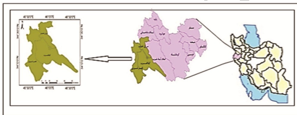
شکل ۱- موقعیت جغرافیایی قطب گردشگری قصرشیرین

گستره استان کرمانشاه با مساحتی ۲۴۴۹۳/۲۵ کیلومترمربع حدود ۱/۴۵ درصد از مساحت کل ایران را دارا می‌باشد که با ۱۴ شهرستان در غرب کشور قرار دارد (سالنامه آماری استان کرمانشاه، ۱۳۹۰). استان کرمانشاه در همه زمینه‌های گردشگری دارای پتانسیل‌های زیادی است بر این اساس با توجه به تقسیم بندی‌های صورت گرفته در طرح جامع گردشگری، استان به ۵ قطب گردشگری تقسیم شده است که هر کدام از این قطب‌ها شهرستان‌هایی را تحت پوشش قرار می‌دهند. قطب گردشگری قصرشیرین به عنوان یکی از قطب‌های گردشگری استان در غرب استان کرمانشاه قرار گرفته که شامل شهرستان‌های قصرشیرین، گیلانغرب و سرپل ذهاب می‌باشد (شکل ۱).