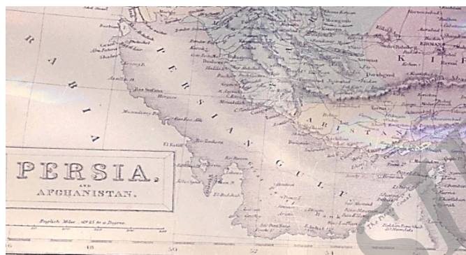
نقشه سال ۱۸۵۴ نقشه ایران که در سال ۱۸۵۴ به وسیله ای.بی.سی. بلاک در ادینبورو انگلیس به طبع رسیده است. در این نقشه جزایر تنب و ابوموسی به رنگ ساحل ایران رنگ آمیزی شده است.

ه) در نقشه «ایران و افغانستان» ۱ که در سال ۱۸۵۴ به وسیله بلاک در ادینبورو بریتانیا به طبع رسیده، جزایر تنب و ابوموسی به رنگ ساحل ایران رنگ آمیزی شده است.