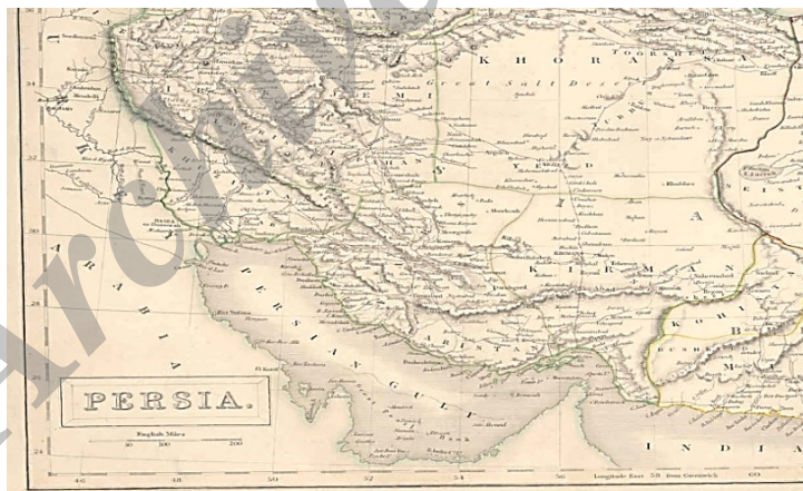
نقشه سال ۱۸۴۰ نقشه ایران که در سال ۱۸۴۰ برای اطلس بلاک بریتانیا تهیه و در لندن به طبع رسیده است . در این نقشه جزایر ابوموسی و تنب بزرگ به رنگ خاک ایران رنگ آمیزی شده است . نقشه مذکور در سال ۱۸۴۴ مجدداً برای اطلس یادشده تهیه و به طبع رسید. در این نقشه جزایر ابوموسی و تنب به رنگ خاک ایران رنگ آمیزی شده است .

د) نقشه ایران که در سال ۱۸۴۰ برای مؤسسه اطلس بلاک بریتانیا تهیه و در لندن چاپ شد. در این نقشه جزایر ابوموسی و تنب به رنگ خاک ایران رنگ‌آمیزی شده‌اند. در نقشه مذکور که دوباره در سال ۱۸۴۴ برای مؤسسه‌ی یادشده تهیه و چاپ شد، جزایر ابوموسی و تنب به رنگ خاک ایران رنگ‌آمیزی شده است.