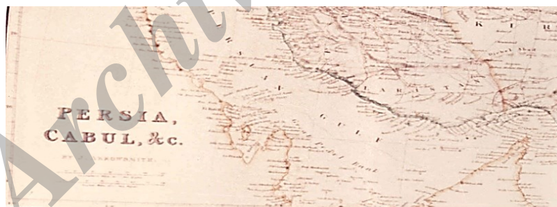
نقشه سال ۱۸۷۳ نقشه ایران و کابل که در سال ۱۸۷۳ به وسیله جی آرو اسمیت تهیه و در انگلیس به طبع رسیده است. در این نقشه جزایر تنب و ابوموسی به رنگ ساحل ایران رنگ آمیزی شده است. اصل نقشه در اتاق نقشه کتابخانه دفتر هند در لندن موجود است.

و) نقشه «ایران و کابل» که در سال ۱۸۷۳ به وسیله «جی آرو اسمیت» ۲ تهیه و در بریتانیا چاپ شد و در آن، جزایر تنب و ابوموسی به رنگ ساحل ایران رنگ آمیزی شده‌اند. اصل نقشه در اتاق نقشه‌ی کتابخانه وزارت امور هند در لندن نگهداری می‌شود.