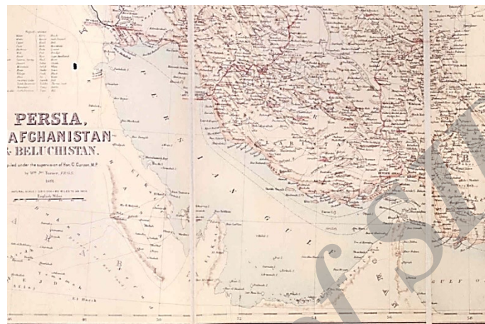
نقشه سال ۱۸۹۱ نقشه نیمه رسمی ایران، افغانستان و بلوچستان که در سال ۱۸۹۱ تحت نظارت لرد کرزن نایب‌السلطنه هند تهیه شد و در ۱۸۹۲ به چاپ رسیده است. در این نقشه جزایر تنب و ابوموسی به رنگ خاک ایران رنگ‌آمیزی شده است. اصل نقشه در اتاق نقشه کتابخانه دفتر هند در لندن موجود است.

ز) نقشه نیمه‌رسمی «ایران، افغانستان و بلوچستان» ۱ که در سال ۱۸۹۱ با نظارت لرد کرزن نایب‌السلطنه هند تهیه شد و در ۱۸۹۲ به چاپ رسید. در این نقشه جزایر تنب و ابوموسی به رنگ خاک ایران رنگ‌آمیزی شده‌اند. اصل نقشه در اتاق نقشه‌ی کتابخانه‌ی وزارت امور هند در لندن موجود است.