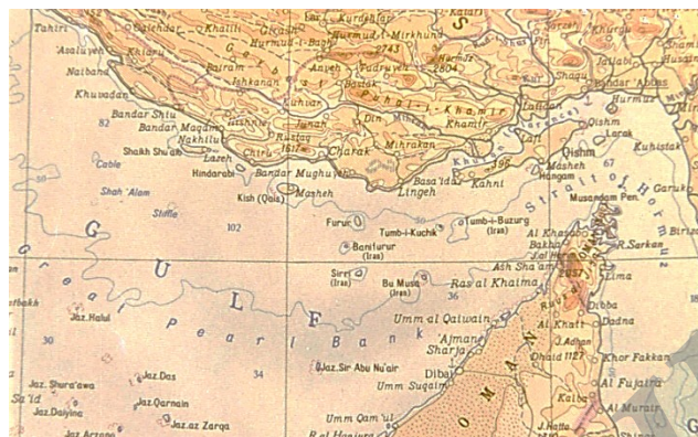
نقشه سال ۱۹۶۷ قلمنت خلیج فارس نقشه رنگی ایران در اطلس جهانی که در سال ۱۹۶۷ به دستور شورای وزیران اتحاد شوروی به وسیله نقش اجرایی مصاحی و نقشه کشی به روسی و انگلیسی تهیه و علاوه بر رنگ آمیزی جزایر تنب و ابوموسی به خاک ایران. نام کشور ایران در کنار این جزایر درج گردیده است. اصل این نقشه و اطلس در اغلب کتابخانه های معتبر جهان از جمله کتابخانه مامرفوند در سازمان ملل متحد، نیویورک و وزارت امور خارجه آمریکا به مر دو زبان موجود است.

ط) نقشه شماره ۱۸، نقشه ۱۸۸۶ وزارت جنگ بریتانیا