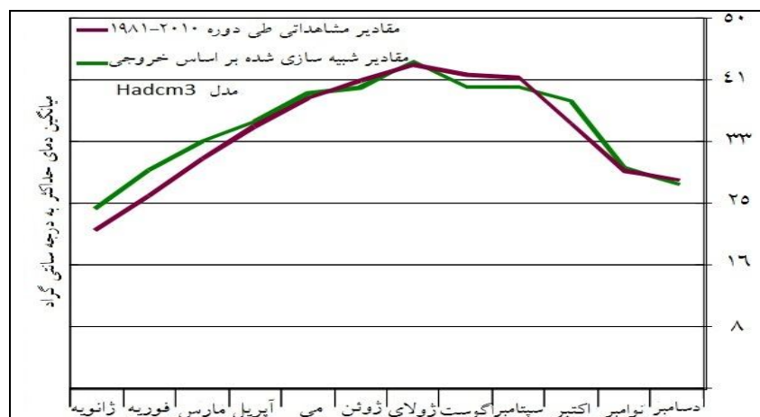
شکل ۲: نمودار مقایسه مقادیر شبیه سازی شده با مقادیر واقعی دمای حداکثر ایستگاه مشهد

احتمال رخداد نسبت به سایر مدل-سناریوها را به خود اختصاص داده است. همچنین با تحلیل عدم قطعیت مربوط خروجی مدل-سناریوها برای دوره‌های آینده (۹۹-۲۰۴۱)، مشخص گردید که کمترین افزایش دما با کمترین دامنه عدم قطعیت بر روی ایستگاه‌های بندرعباس و اهواز در نیمه جنوبی ایران و بالعکس بیشترین افزایش دما با بیشترین دامنه عدم قطعیت بر روی ایستگاه‌های مشهد و تبریز در نیمه شمالی ایران مشاهده می‌شود.