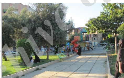
شکل ۵: تصویری از پارک چاله باغ

پارک چاله باغ در مرکز شهر گرگان دارای طبیعت زیبایی بوده که این بوستان را مکانی برای تفریح و تفرج تبدیل کرده است. این پارک در سال ۱۳۷۵ افتتاح گردیده است و مساحتی حدود ۲۸۰۰۰ مترمربع دارا است. این بوستان از سویی به خیابان ۵