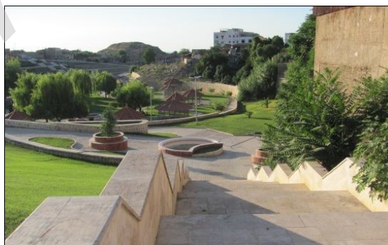
شکل ۳: تصویری از پارک ملت

پارک ملت یکی از پارک‌های تازه تأسیس در گرگان هست. این پارک در محله اسلام‌آباد در خیابان باهنر گرگان ساخته شده است. این بوستان در سال ۱۳۸۵ احداث شده است که مساحتی حدود ۳۵۰۰۰ مترمربع را شامل می‌شود. که ۱۱۵۰ متر فضای بازی