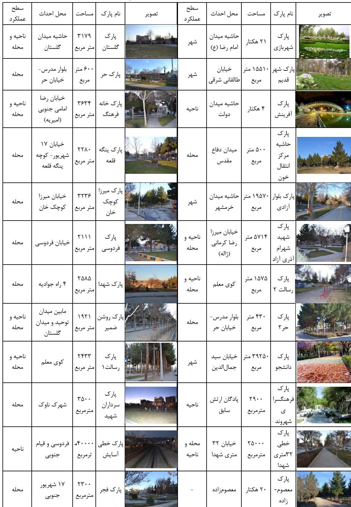
جدول ۳: پارک‌های درون شهری بجنورد، مأخذ: انصاری مود و معصومی، ۱۳۸۹ و یافته‌های تحقیق، ۱۳۹۵