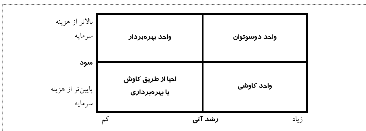
شکل ۱- ماتریس بررسی توانمندی ها

سود آتی شکل گرفت. با جمع‌بندی و پالایش این کدها می‌توان گفت مصاحبه‌شوندگان دو شاخص کلیدی "سود" و "رشد" را برای شناسایی قابلیت‌های بهره‌برداری و کاوش ارائه داده‌اند. شاخص "سود" نشان‌دهنده میزان توانمندی SBU در استفاده از قابلیت‌های بهره‌برداری است. مصاحبه‌ها نشان دهنده آن است که تحلیل سود در سطح هلدینگ براساس میزان سرمایه‌گذاری در SBU و هزینه‌ای که برای شرکت دارد مورد بررسی قرار می‌گیرد. بنابراین ابعاد شاخص "سود" بر مبنای بالاتر یا پایین‌تر بودن از هزینه سرمایه‌گذاری مورد نظر قرار می‌گیرد. این رویکرد با