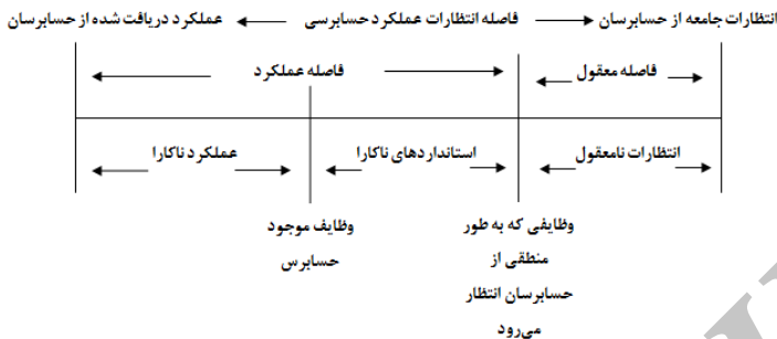
شکل ۱. ساختار فاصله انتظارات عملکرد حسابرسی (پورتز، ۱۹۹۳، ص ۵۰)

پورتز (۱۹۹۳، ۴۹) فاصله انتظارات را بدین گونه تعریف کرده است: