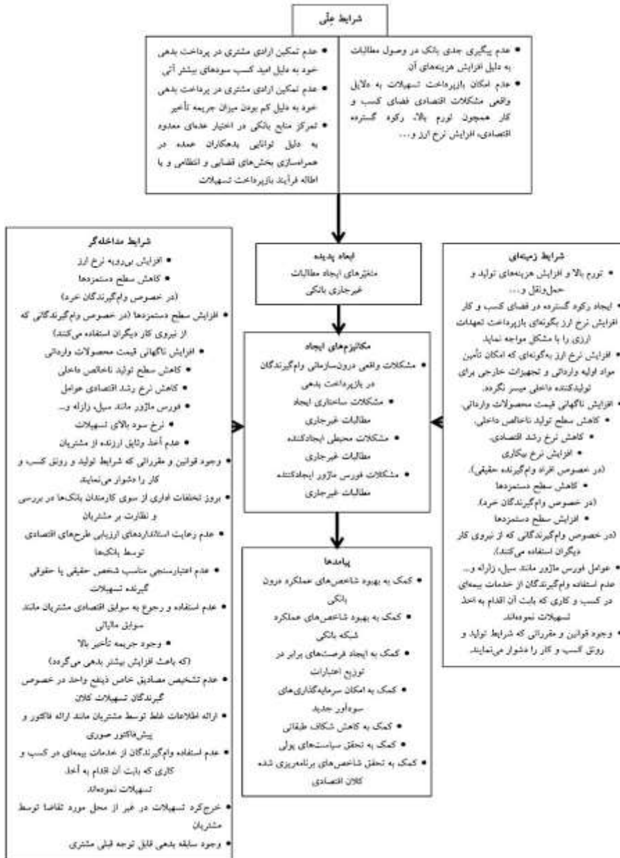
نمودار (۳): مدل پارادایمی تعیین متغیرهای تأثیرگذار بر مطالبات غیر جاری بانکی کشورمان