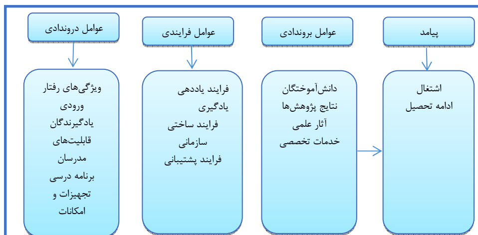
شکل (۱) چهارچوب مفهومی تحقیق