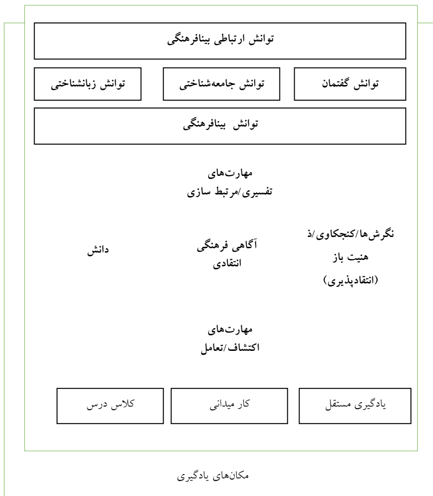
شکل (۱) مدل توانش ارتباطی بین‌فرهنگی (بایرام، ۲۰۰۹، ۳۲۳)

شکل (۱) عناصر تشکیل‌دهنده مدل توانش ارتباطی بین‌فرهنگی (بایرام، ۲۰۰۹، ۳۲۳) را نشان می‌دهد.