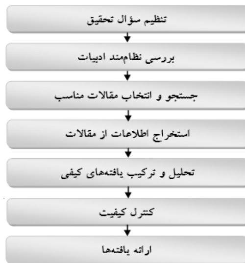
شکل (۱) گام‌های فراترکیب در پژوهش حاضر

پژوهش حاضر به کار گرفته شده است. برای اجرای روش فراترکیب یا سنتزپژوهی در پژوهش حاضر از روش هفت مرحله‌ای ارائه شده ساندلوسکی و باروسو ۱ (۲۰۰۷) مطابق شکل (۱) استفاده شده است که در ادامه توضیحاتی در خصوص هر مرحله ارائه می‌شود.