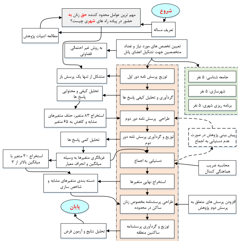
نمودار ۲: مراحل انجام تکنیک دلفی

متغیرهای ارائه شده را عهده‌دار شده‌اند. مراحل این بخش از پژوهش در نمودار ۲ به تصویر کشیده شده است.