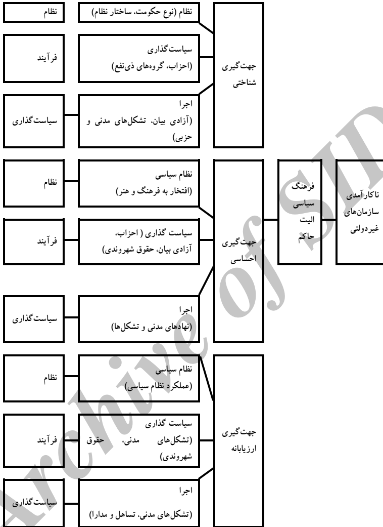
شکل (۱-۱) مدل مفهومی پژوهش