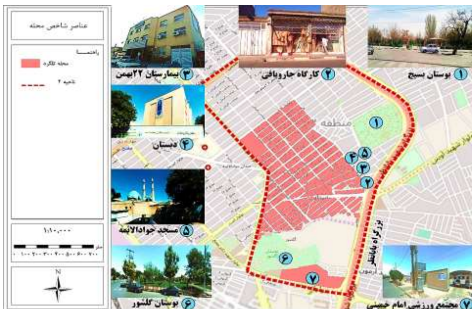
شکل ۳. عناصر شاخص محله تلگرد