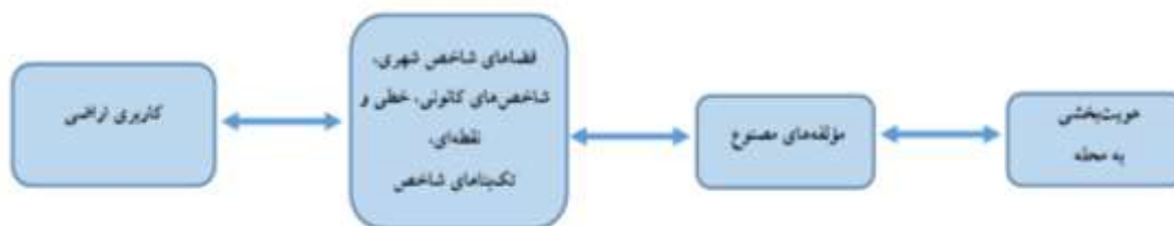
نمودار ۱. شاخص‌ها و متغیرهای تحقیق