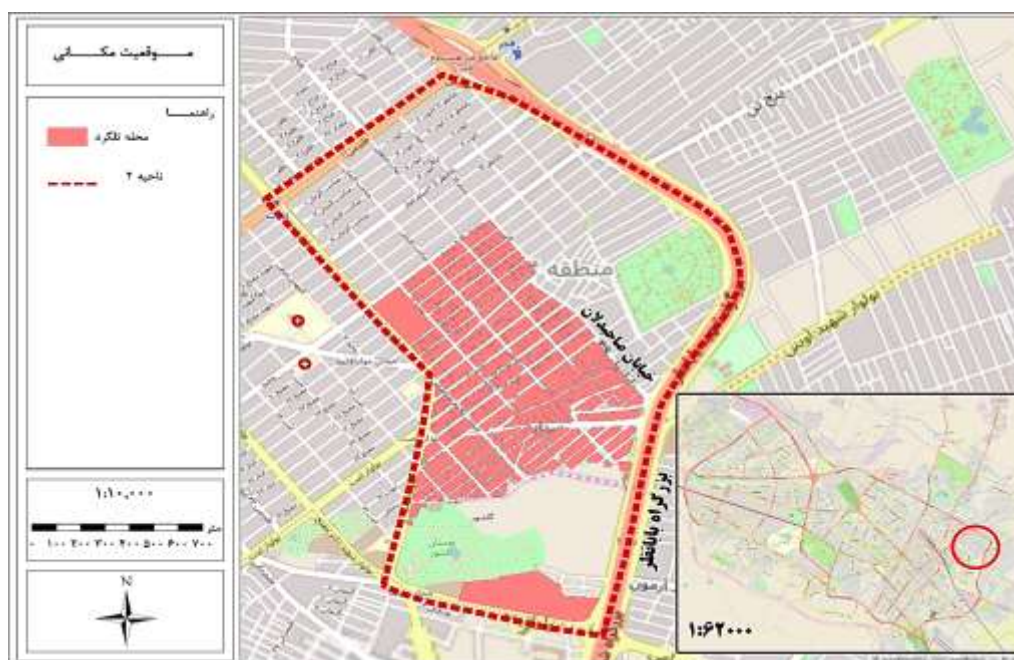
شکل ۱. موقعیت محدوده مورد مطالعه محله تلگرد