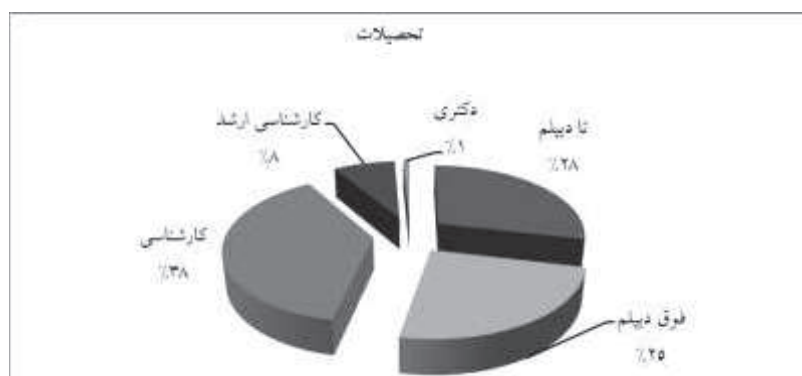
نمودار ۱: توزیع فراوانی افراد نمونه بر حسب میزان تحصیلات

اطلاعات توصیفی افراد نمونه از منظر تحصیلات، پست سازمانی و سنوات خدمت مورد بررسی قرار گرفت که در نمودارهای ۱ تا ۳ ارائه شده است: