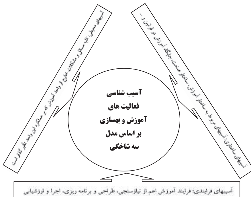
شکل ۱: مدل مفهومی پژوهش