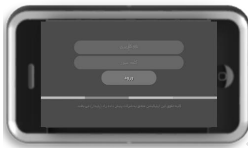
شکل ۲: صفحه ورود

پس از بررسی‌های کارشناسی به‌صورت نمونه نرم‌افزار کاربردی ۱ همراه پایدار انتخاب و برای جامعه هدف مورد استفاده قرار گرفت.