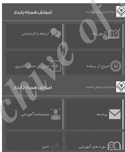
شکل ۳: منوهای نرم‌افزار کاربردی