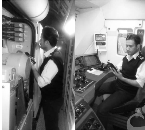
شکل ۴: لوکوموتیوران در حال مشارکت در فعالیت آموزشی از طریق تلفن همراه در زمان توقف منبع: (شریفی و همکاران، ۱۳۹۵)

در شکل ۴ مشارکت لوکوموتیوران در این طرح آموزشی در زمان توقف مشاهده می‌شود.