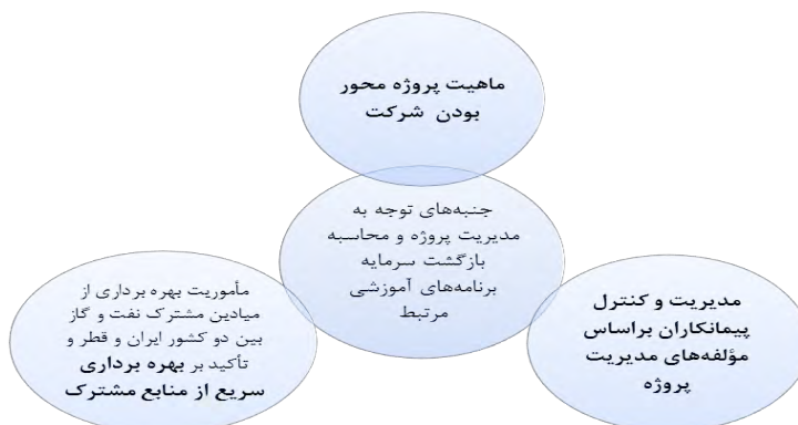
شکل شماره (۱) دلایل توجه به مدیریت پروژه جهت محاسبه نرخ بازگشت سرمایه

با توجه به اینکه افتتاح و بهره‌برداری از هر بخشی از منابع مشترک بین دو کشور وابسته به فناوری و دانش فراوانی و از جمله مدیریت پروژه می باشد، تکلیف محوری آموزش و توسعه منابع انسانی شرکت نفت و گاز پارس نیز تقویت مدیران پروژه‌های شرکت ترسیم گردید و به عنوان یکی از محورهای اصلی رشد و بالندگی منابع انسانی ابلاغ شد و براساس همین نقش بنیادی، منابع قابل توجهی هم به بحث مدیریت پروژه تخصیص یافت. پس از اجرای برنامه‌های توسعه و آموزش در حوزه مدیریت پروژه و ضرورت بررسی میزان اثربخشی دوره‌های آموزشی با محوریت مدیریت پروژه از جانب مدیران ارشد سازمان، مقرر گردید پژوهشی با رویکرد تعیین میزان بازگشت سرمایه در این حوزه تعریف شده و مورد بهره‌برداری قرار گیرد. پژوهش مرتبط سازماندهی شد و تلاش شده است نتیجه پژوهش جهت شناسایی ابعاد میزان بازگشت سازمان و سایر تأثیرات قابل تأمل در این مقاله ارائه گردد.