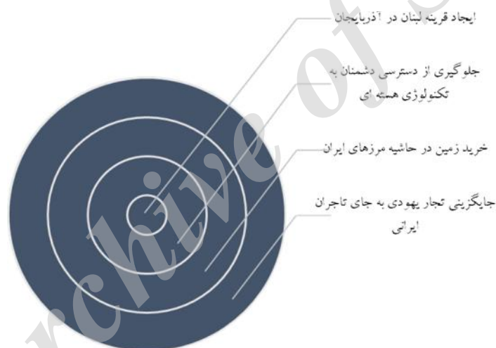
نمودار ۱: مهم‌ترین اهداف اسرائیل از حضور در آذربایجان (نمودار از نویسندگان بر اساس کامران و دیگران، ۱۳۹۰: ۷۶-۷۲).

این چالش در ارتباط با ایران، از دست دادن منافع مالی و سیاسی فراوان عبور خطوط انتقال انرژی از خاک خود بوده است. از پروژه «قرن» در واقع نقطه شروع اختلافات ایران و آذربایجان نام برده می‌شود که در آن ایران به دلایلی که در بالا اشاره گردید، کنار گذاشته شد و این در صورتی بود که با توجه به کمک‌های فراوانی که این کشور در تأمین نیازهای جمهوری نخجوان در جنگ قره‌باغ داشت، انتظار چنین رفتاری را از دولت آذربایجان نداشت. - زمینه‌سازی برای نفوذ قدرت‌های فرامنطقه‌ای و منطقه‌ای در منطقه قفقاز از جمله ایالات متحده آمریکا، ناتو، ترکیه (احداث پایگاه نظامی در نخجوان و رقابت با ایران و روسیه در منطقه قفقاز)، اسرائیل (ایجاد قرینه لبنان در آذربایجان)، عربستان سعودی (با هدف گسترش اندیشه وهابیت) (جوادی و دیگران، ۱۳۹۰: ۱۰۱-۱۰۲). گسترش نفوذ هر کدام از کشورهای یادشده باعث محدود شدن میدان عمل ایران در ماورای مرزهای شمال غربی خود می‌شود. نمودار ۱، مهم‌ترین اهداف اسرائیل از حضور در آذربایجان را نشان می‌دهد: