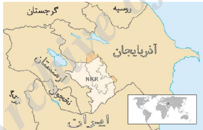
نقشه ۱: موقعیت جغرافیایی جمهوری خودمختار نخجوان (https://maps.google.com).

این جمهوری طبق آمار، در ابتدای سال ۲۰۱۵ میلادی، بالغ بر ۴۳۹۸۰۰ نفر جمعیت داشته است (بانک جهانی، ۲۰۱۵). مساحت این منطقه به ۵۵۰۰ کیلومتر مربع می‌رسد و از نظر ترکیب قومیتی، از کل جمعیت این جمهوری حدود ۹۹/۱ درصد ترک، ۰/۱۵ درصد روس تبار و بقیه را سایر قومیت‌ها مانند کردها و گرجی‌ها تشکیل داده است (Nakhchivan, 2005: 112).