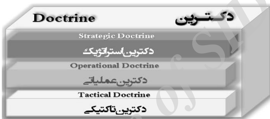
نمودار ۳: لایه‌های دکترین

از اقدامات روبرو هستیم که به طور عمده براساس گستره زمانی، اهمیت و دامنه اثرگذاری در سه سطح استراتژیکی، عملیاتی و تاکتیکی تقسیم‌بندی می‌شوند. هر سطح، به حضور مؤثر و پیاده‌سازی دکترین پایه در سطح اجتماع، کمک می‌کند. ۱ از آنجایی که رویکرد مورد نظر نقش مدل‌سازی دارد، هر یک از این سطوح زیرمجموعه دکترین و با عنوان لایه‌های دکترینال شناخته می‌شوند و به مثابه مجاری عینیت یافتن دکترین به شمار می‌آیند که عبارتند از: دکترین استراتژیکی، دکترین عملیاتی و دکترین تاکتیکی ۲ . بنابراین، ساختار کلی آن به شکل زیر است: