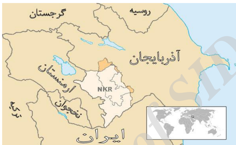
نقشه ۱: موقعیت جغرافیایی جمهوری خودمختار نخجوان (https://maps.google.com).

منطقه قفقاز و گوشه شمال غربی ایران می‌باشد و ۵۵۰۰ کیلومتر مربع وسعت دارد ( Zaman, 2015: 86). طبق آمار سال ۲۰۱۵ میلادی، نخجوان بالغ بر ۴۳۹۸۰۰ نفر جمعیت داشته است (بانک جهانی، ۲۰۱۵). از نظر ترکیب قومیتی، از کل جمعیت؛ حدود ۹۹/۱ درصد ترک، ۰/۱۵ درصد روس‌تبار و بقیه را سایر قومیت‌ها مانند کردها و گرجی‌ها تشکیل داده‌اند (Nakhchivan, 2005: 112).