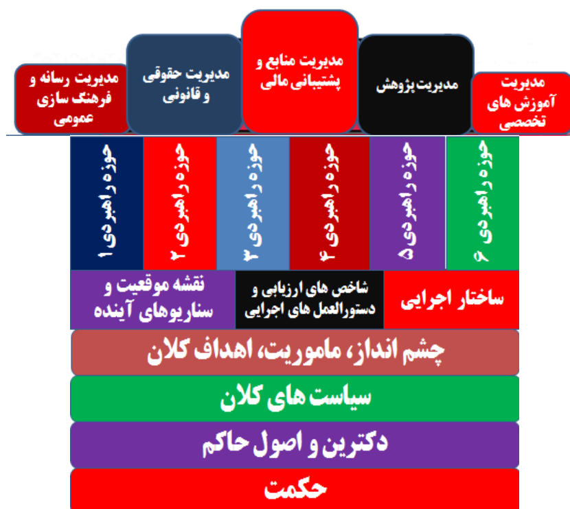
شکل ۲- الگوی معماری راهبردی (قسمت دوم)