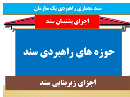
شکل ۱- الگوی معماری راهبردی ( قسمت اول)