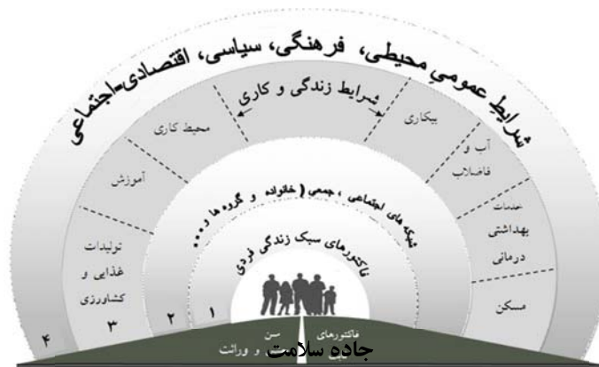
شکل ۲- شرایط عمومی محیطی، فرهنگی، سیاسی، اقتصادی-اجتماعی. برداشتی از: Dahlgren, G. & Whitehead, M. 1991

زیستی-اجتماعی آقایان وایت‌هد و دالگرن (۱۹۹۱) گرفته تا مدل تعیین‌کننده‌های اجتماعی نابرابری سلامت کمیسیون سازمان جهانی بهداشت (WHO, 2008) به صراحت بیان میدارند که سلامت در بطن زندگی روزمره مردم و از درون سیستم‌های پیچیده‌ای که وابسته به متغیرهای سیاسی، اجتماعی، اقتصادی و فرهنگی، فردی و زیستی هستند خلق می‌شود (شکل ۲) (Adam B, et al. 2014).